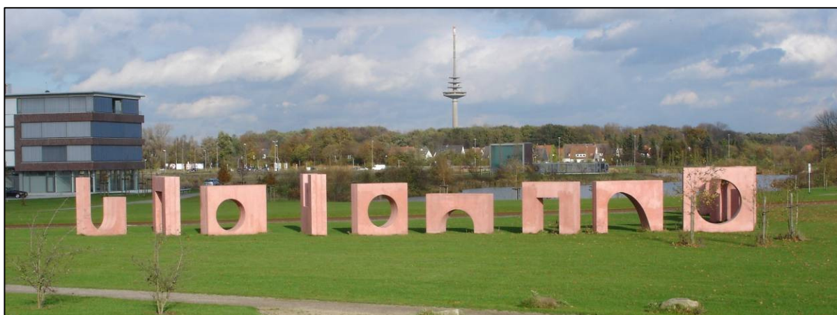
Skulptur im Friedenspark

Die Preise verstehen sich zuzüglich der gesetzlichen Mehrwertsteuer. Weiteres Material auf Anfrage.