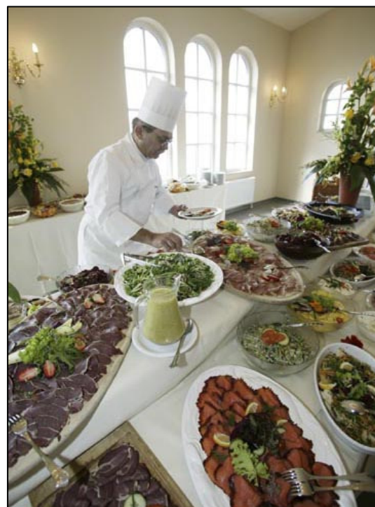
Büffet in der Cafeteria