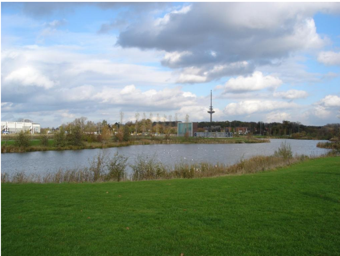
Der See im Friedenspark hinter der Friedenskapelle